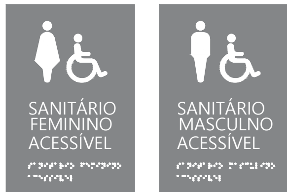
03 EXEMPLOS ESCALA 1/5